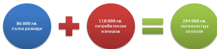
Фигура 6: Склонност да се плати, измерена чрез метода на пътните разходи

Склонността да се плати представлява сбора от потребителския излишък и реално направените транспортни разходи и е в размер на 204 000 лв. (Фигура 6) .